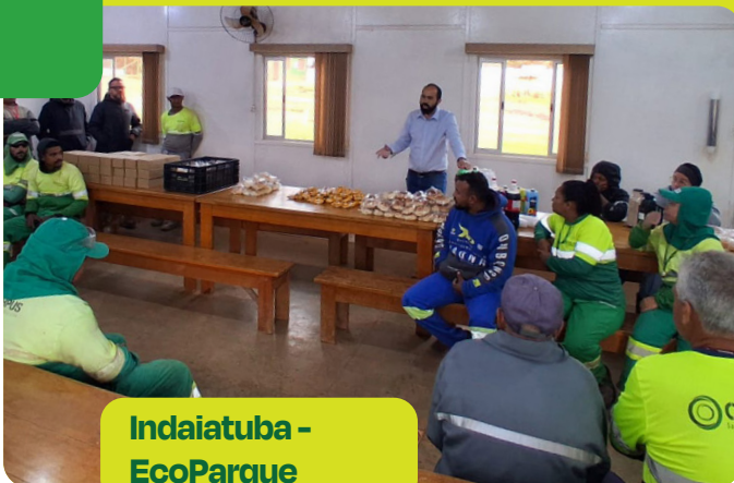
Indaiatuba - EcoParque