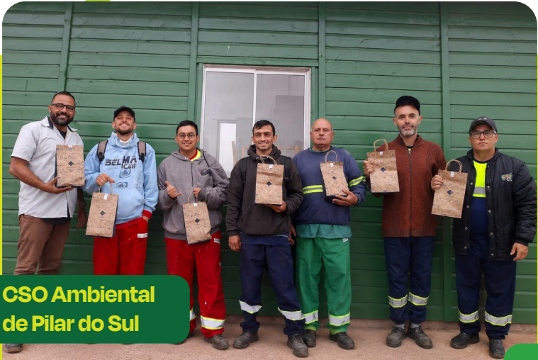
CSO Ambiental de Pilar do Sul