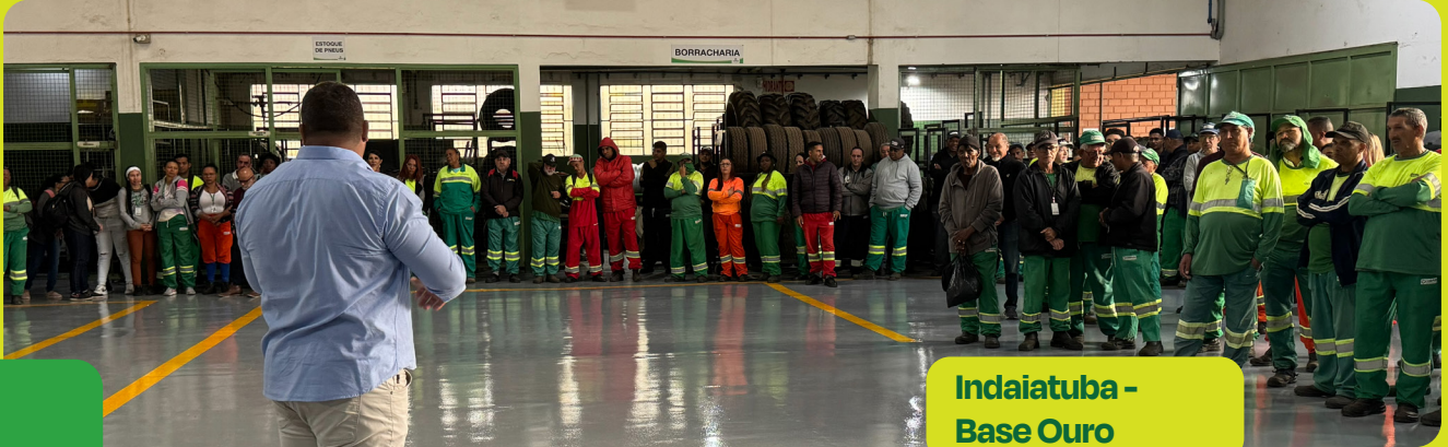
Indaiatuba - Base Ouro