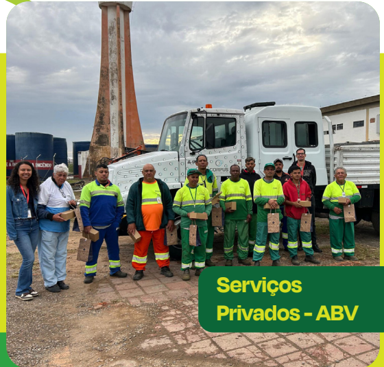
Serviços Privados - ABV